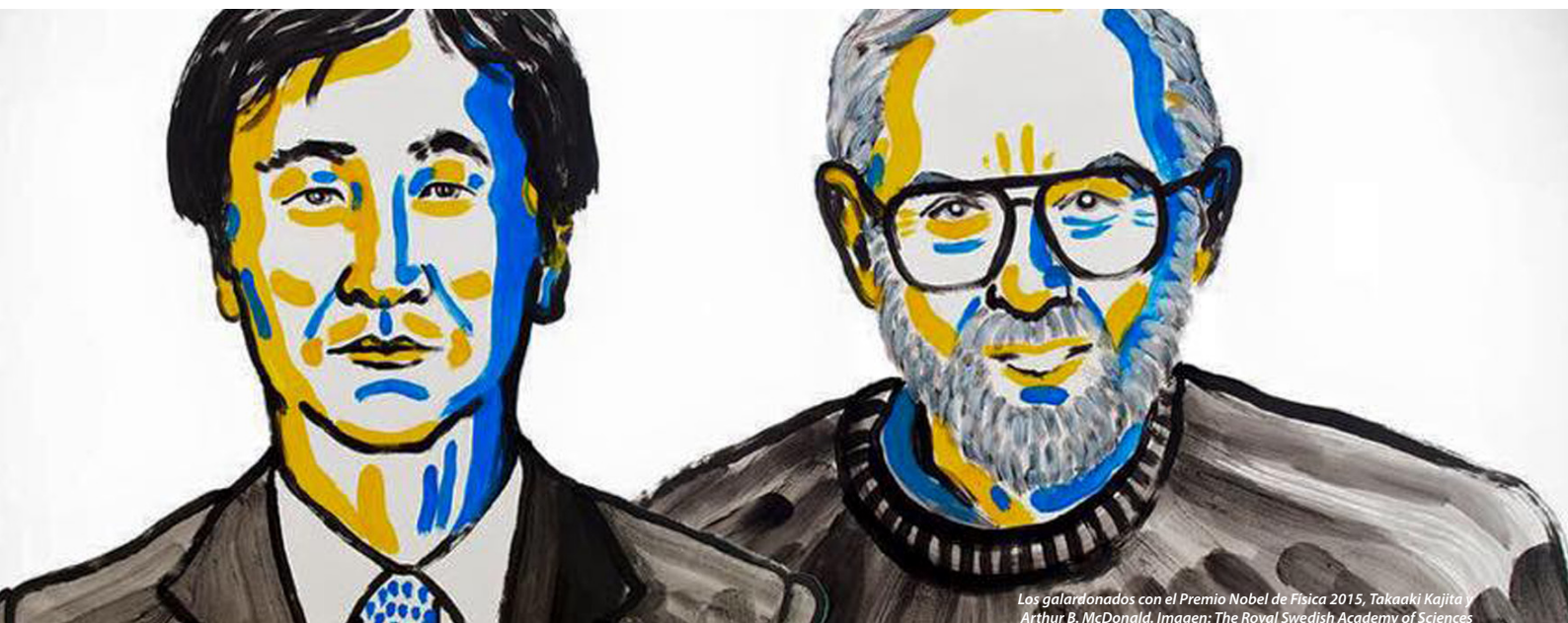
Los galardonados con el Premio Nobel de Física 2015, Takaaki Kajita y Arthur B. McDonald.