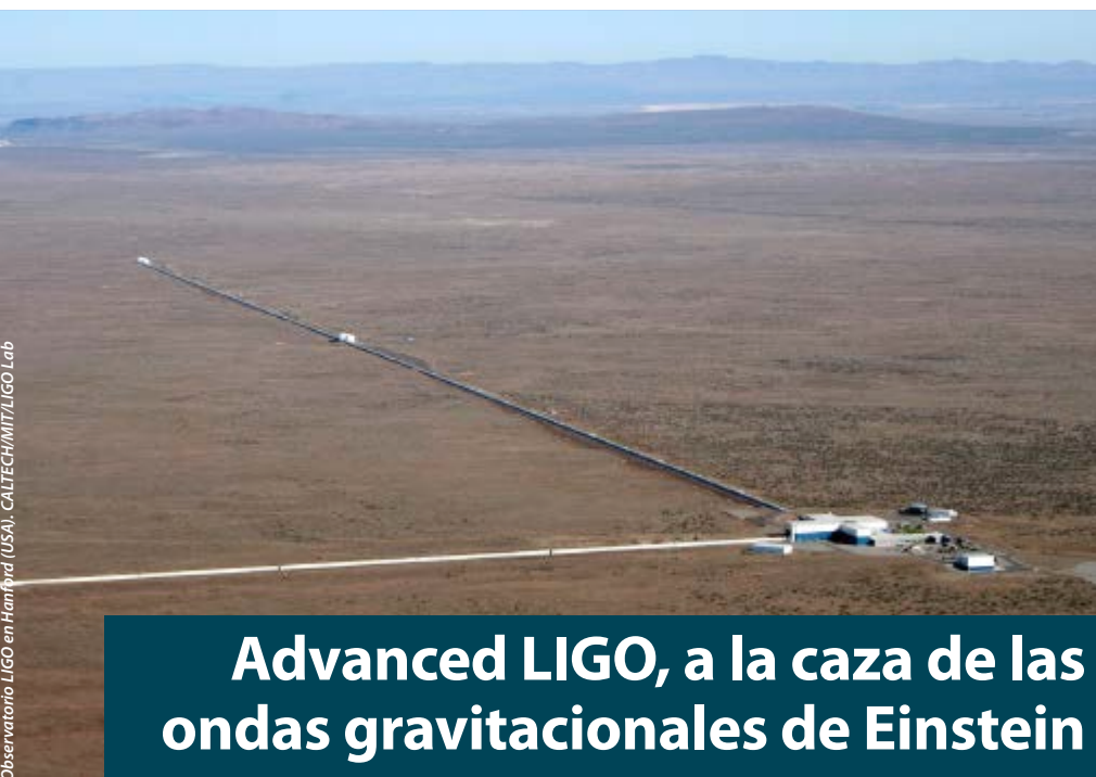
Observatorio LIGO en Hanford (USA).

El CPAN surge en 2007 en el marco del programa Consolider-Ingenio 2010. Está formado por más de 400 científicos de 26 grupos de investigación. En este tiempo, ha cofinanciado 160 contratos de personal investigador y técnico, apoyado la organización de más de 100 escuelas y congresos, y sus investigadores han publicado más de 5.000 artículos en revistas de impacto. También ha apoyado la participación de sus grupos en los principales experimentos a nivel internacional.