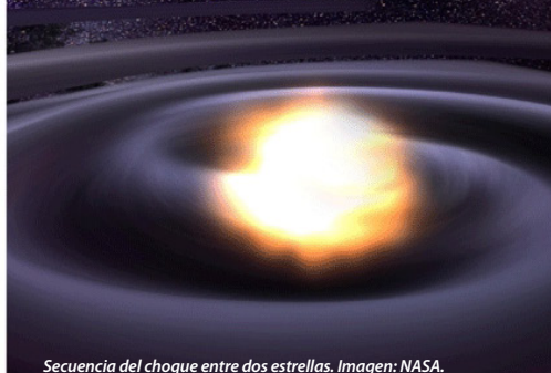
Secuencia del choque entre dos estrellas.