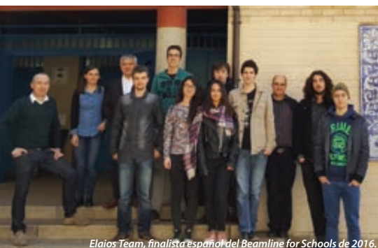
Elaios Team, finalista español del Beamline for Schools de 2016.

Este es el primer análisis que ha combinado los datos y el esfuerzo de ambas colaboraciones, y supone el primer paso para una colaboración más estrecha. En este trabajo, el grupo de investigación ANTARES-KM3NeT del Instituto de Física Corpuscular (IFIC, CSIC-UV) ha jugado un papel destacado, ya que una de sus responsabilidades es la identificación de las fuentes de neutrinos.