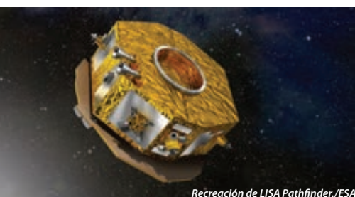
Recreación de LISA Pathfinder/ESA

Ambos descubrimientos fueron posibles gracias a las capacidades mejoradas de Advanced-LIGO, que permiten un gran aumento del volumen del universo explorado. Para el próximo periodo de observación en otoño las mejoras en la sensibilidad del detector permitirán a LIGO alcanzar un volumen de universo de 1,5 a 2 veces mayor.